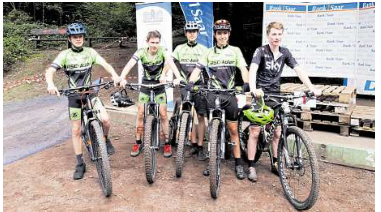
MTB-Team des Hochwald-Gymnasiums.

Gute Platzierungen bei den Saarländischen Schulmeisterschaften im Mountainbike