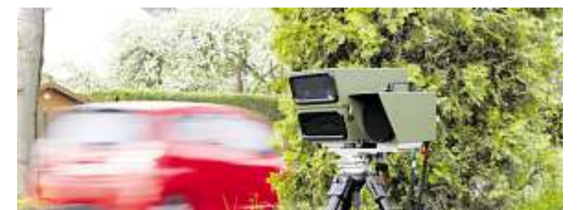
Angepasstes Fahren bringt mehr Sicherheit im Straßenverkehr.

In der 37. Kalenderwoche, also noch bis zum 14. September, werden in Abstimmung mit der Polizeiinspektion Nordsaarland schwerpunktmäßig Geschwindigkeitsüberwachungen im Stadtteil Wadern stattfinden. Selbstverständlich können auch in anderen Stadtteilen unangekündigte Kontrollen stattfinden. Wir hoffen auf wenig Arbeit für unsere Kolleginnen und Kollegen. Das trägt zur Verkehrssicherheit bei und schont den Geldbeutel der Autofahrer. Die Stadtverwaltung wünscht allen Verkehrsteilnehmern eine gute Fahrt.