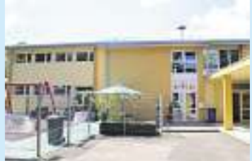
Kita „Haus der kleinen Strolche“ in Löstertal.