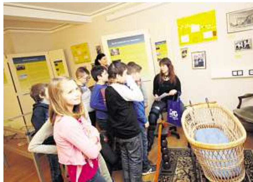
Wie haben sich die Lebensverhältnisse von Kindern in den letzten 200 Jahren verändert? Dieser Frage gingen Schüler der Grundschule Nunkirchen in der Sonderausstellung nach.