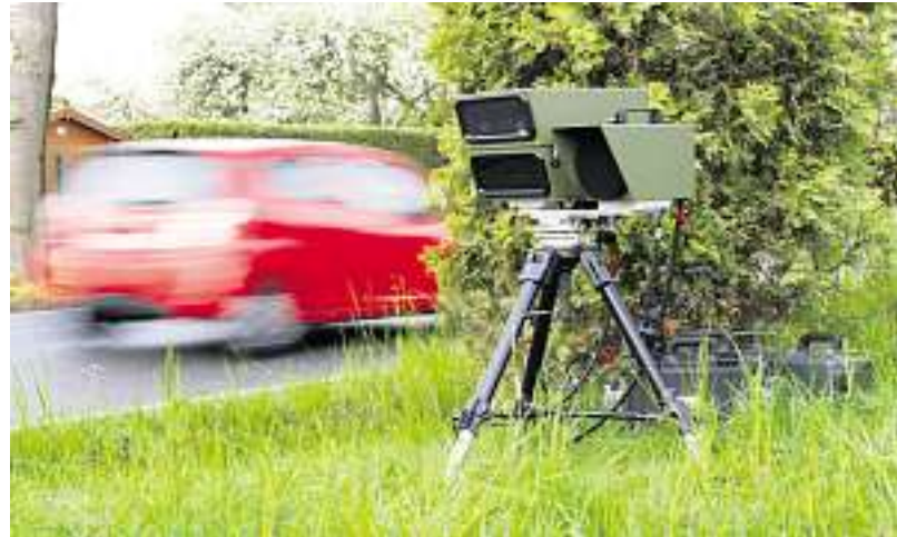
Angepasstes Fahren bringt mehr Sicherheit im Straßenverkehr.