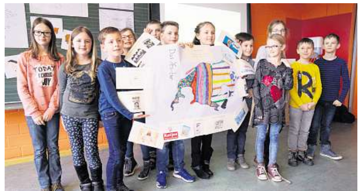
Die „Querdenker“ stellten das Yes-Tier vor.

Hintergrund: Die Idee zu den Querdenkertagen am Hochwald-Gymnasium ist in Zusammenarbeit mit der Beratungsstelle Hochbegabung Saarland, IQXXL, entstanden. In jedem Schuljahr gibt es zwei Projektphasen, die jeweils unter einem besonderen Rahmenthema stehen. Über einen Zeitraum von zwei Monaten wird einmal in der Woche ein Projekttag am HWG durchgeführt und am Ende werden die Ergebnisse der Projektarbeit vorgestellt. Das Hochwald-Gymnasium arbeitet dabei mit den Grundschulen Wadrill, Nunkirchen, Lockweiler und Primstal zusammen. Die Teilnehmer werden von den entsprechenden Schulen vorgeschlagen und kommen aus den Klassenstufen 4 und 5.